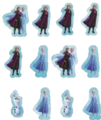
APQ IMP FROZEN 2

INNER: 06x05un 3,5x10,5cm EAN13: 7899061511388 DUN14: 17899061511385 REF.: 310027