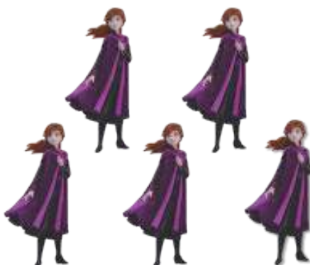
MINI PERSONAGEM FROZEN 2 ANNA

INNER: 06x05un 5,5x11cm EAN13: 7899061511043 DUN14: 17899061511040 REF.: 310026