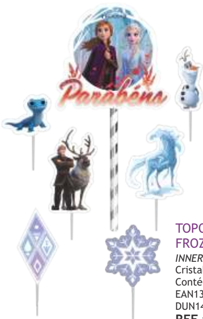
TOPO DE BOLO IMP FROZEN 2 INNER: 03x01un Cristal: 4,7x8,5cm Contém 07 itens EAN13: 7899061511128 DUN14: 17899061511125 REF.: 310039

VENDA EM PACOTE MASTER COM 3 EMBALAGENS*