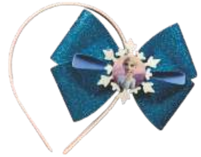
TIARA FROZEN 2 INNER: 06x01un Laço: 13,5x10cm EAN13: 7899061511173 DUN14: 17899061511170 REF.: 310037