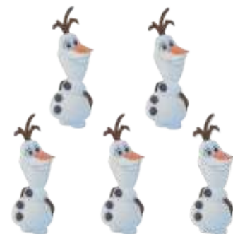
MINI PERSONAGEM FROZEN 2 OLAF

INNER: 06x05un 4,5x11cm EAN13: 7899061511371 DUN14: 17899061511378 REF.: 310025