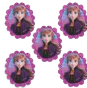
MINI CARINHA FROZEN 2 ANNA

INNER: 06x05un 05x06cm EAN13: 7899061511005 DUN14: 17899061511002 REF.: 310021