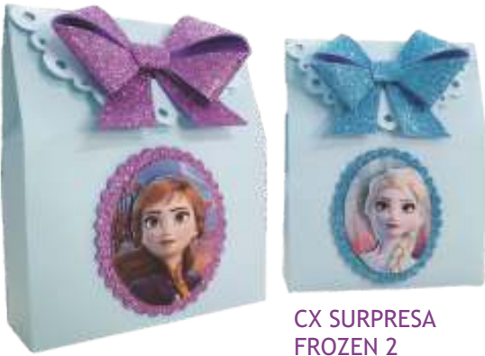
CX SURPRESA FROZEN 2 INNER: 03x06un 10,5x13,5x4,5cm Kit com 06 itens EAN13: 7899061511098 DUN14: 17899061511095 REF.: 310010