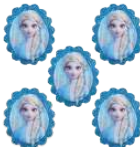
MINI CARINHA FROZEN 2 ELSA

INNER: 06x12un Anna e Elsa (s/palito): 4,5x5,5cm EAN13: 7899061511067 DUN14: 17899061511064 REF.: 310035