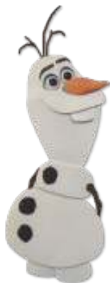
MINI PAINEL FROZEN 2 OLAF

INNER: 06x01un 10x22,5cm EAN13: 7899061511357 DUN14: 17899061511354 REF.: 310022