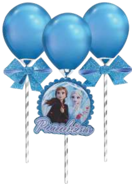
TOPO DE BOLO 3D FROZEN 2 GLITTER INNER: 03x01un Canudos com laço: 9,5x23cm Contém 03 itens EAN13: 7899061511135 DUN14: 17899061511132 REF.: 310038