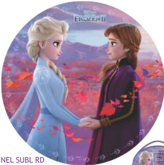
PAINEL SUBL RD FROZEN 2 MOD 02 Diâmetro: 1,55m EAN13: 7899061511753 REF.: 310045