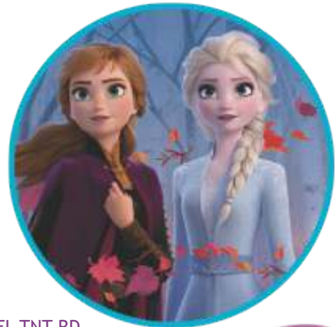
PAINEL TNT RD FROZEN 2 Diâmetro: 1,01m EAN13: 7899061511586 REF.: 310047