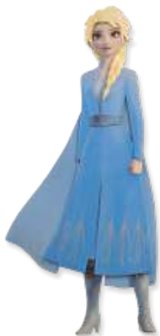
MINI PAINEL FROZEN 2 ELSA

INNER: 06x01un 10,5x23cm EAN13: 7899061511081 DUN14: 17899061511088 REF.: 310023