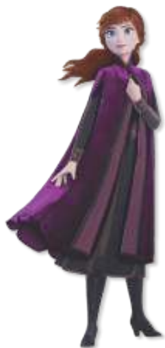
MINI PAINEL FROZEN 2 ANNA

INNER: 06x01un 10,5x23cm EAN13: 7899061511081 DUN14: 17899061511088 REF.: 310023