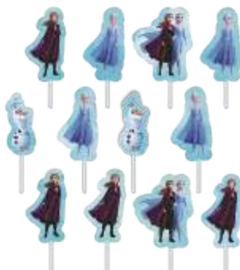
PALITOS DECOR IMP FROZEN 2

INNER: 06x12un Anna: 03x5,5cm EAN13: 7899061511036 DUN14: 17899061511033 REF.: 310003