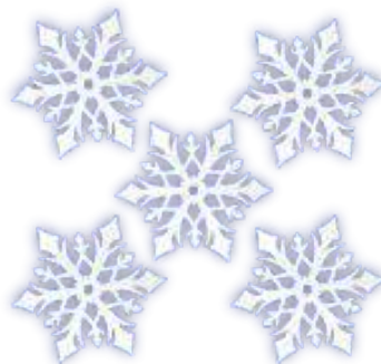
APQ GLITTER FROZEN 2 FLOCO DE NEVE MÉDIO

INNER: 06x01un 07x20cm EAN13: 7899061511364 DUN14: 17899061511361 REF.: 310024