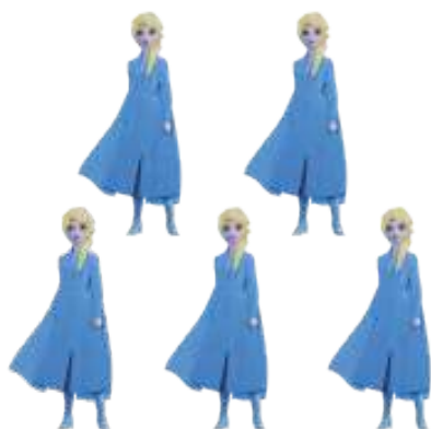
MINI PERSONAGEM FROZEN 2 ELSA

INNER: 06x05un 05x5,5cm EAN13: 7899061457181 DUN14: 17899061457188 REF.: 310001